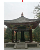
唐实际寺遗址纪念亭